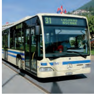
FART SA www.centovalli.ch