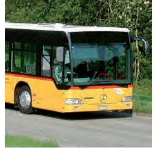
Autopostale Svizzera SA www.autopostale.ch