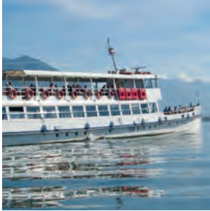
Navigazione Lago Maggiore www.navigazione.laghi.it

I nostri lidi e le spiagge sono comodamente raggiungibili con i trasporti pubblici. Buon viaggio! Unsere Lidos und Strände können mit den öffentlichen Verkehrsmitteln bequem erreicht werden. Gute Fahrt! Nos lidos et plages sont facilement joignables avec les transports publics. Bon voyage! Our lidos and beaches can easily be reached by public transport. Have a nice journey!