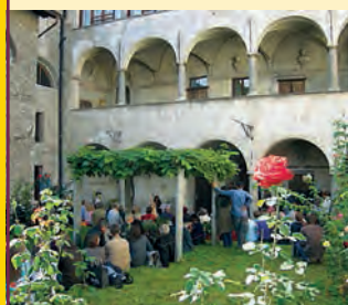
WALKING TICINO LOCARNO 02.10.2011