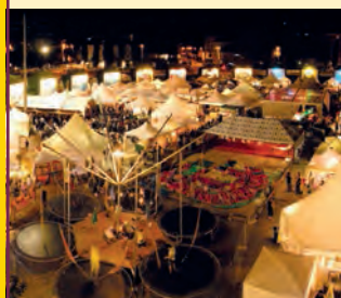
IL CASTELLO INCANTATO LOCARNESE 13 - 28.08.2011