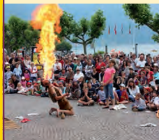
SWISS BEACHVOLLEY LOCARNO 10 - 13.06.2011