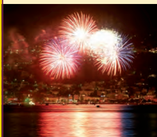
ROTONDA DEL FESTIVAL LOCARNO 02 - 13.08.2011