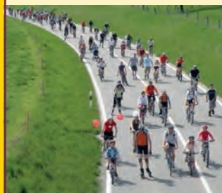
ARTISTI DI STRADA ASCONA 10 - 13.06.2011