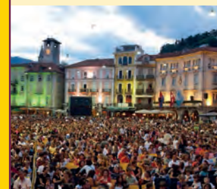
KIDS TRIATHLON LOCARNO 03.09.2011