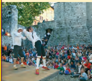
SLOW UP TICINO LOCARNO 29.05.2011