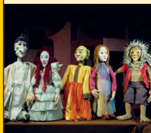
FILM PER RAGAZZI LOCARNO 14.08.2011