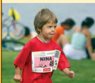
LE CORTI IN CANTO LOCARNO 24.09.2011