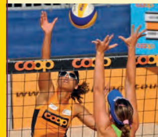
LUCI E OMBRE LOCARNO 21 - 23.07.2011