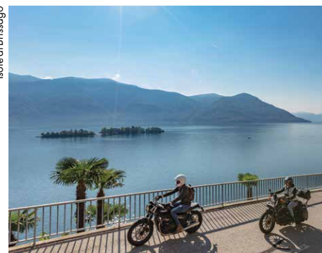
Isole di Brissago

Ein klassischer Ausflug dem Lago Maggiore entlang, 170 km quer durch wunderschöne Ortschaften der Lombardei, des Piemonts und des Kantons Tessin.