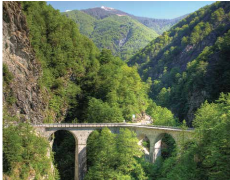
Ponte Oscuro, Russo

Nur dreissig Kilometer trennen Locarno von Spruga, respektive Vergeletto, hoch oben im Valle Onsernone. Zu Beginn der Tour fährt man entlang des Maggia-Fluss nach Ponte Brolla, vorbei an Verscio, wo sich das berühmte Teatro Dimitri befindet, fährt weiter bis Cavigliano und von dort aus auf die steile Strasse, die ins Valle Onsernone führt, das wildeste, ursprünglichste und ruhigste Tal der ganzen Region. Von diesem Punkt an ändert sich die Strasse abrupt. Enge Kehren und Haarnadelkurven machen diese Tour für jeden Biker zu einem anspruchsvollen und begeisternden Abenteuer.