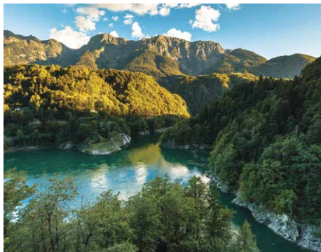
Lago di Palagnedra

Die Fahrt beginnt in Locarno in Richtung Cannobio, auf einer sanft gekurvten Strasse mit Sicht auf den See. In Cannobio beginnt die Strasse zum Valle Cannobina, die von Wäldern und einer Abfahrt über eine Bergstrasse mit engen Kurven charakterisiert ist. Am Schnittpunkt mit Malesco biegt man in die Strasse ein, die durchs Val Vigezzo über Re mit der berühmten Wallfahrtskirche ins Centovalli führt. Weiter kurvig durch das Centovalli, vorbei an unverkennbaren Dörfern. Für ein paar Kilometer genießt man von der Strasse aus einen faszinierenden Blick auf den Fluss Melezza, deren Farben ein Spektakel für Herz und Auge bietet – es lohnt sich, dafür einen Zwischenhalt einzulegen. Über eine schmale malerische Brücke erreicht man Intragna, bekannt für seinen freistehenden hohen Kirchturm.