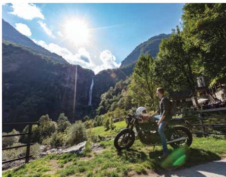
Foreglio, Val Bavona

Die unwegsame Natur, das Wasser, die felsige Landschaft und die Geschichte werden ideal ergänzt durch eine schmackhafte Gastronomie in den vielen Grotti des Vallemaggia. Die „Vallemaggia Magic Tour“ beginnt in Locarno auf wenig anspruchsvollen Strassen, vorbei an Ortschaften mit charakteristischen Dorfkernen, ausgezeichnet durch die typischen Steinhäuser. Von Cevio aus kann man auf technisch etwas anspruchsvolleren Strecken die verschiedenen Seitentäler erkunden – Lavizzara, Bavona, Rovana und Valle di Campo.