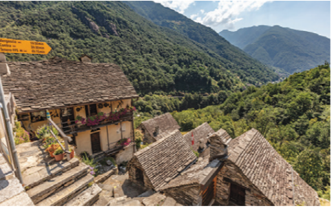
Située sur un coteau boisé, ce village pittoresque, d’une belle harmonie architecturale et avec des maisons en pierre, est protégé au niveau national.

Posto su un pendio tra i boschi, è un villaggio caratteristico con case in pietra, arditamente costruite molto armoniose, protetto a livello nazionale. Con i suoi 15 abitanti è uno dei più piccoli villaggi della Svizzera. Vi si trovano un “albergo diffuso” e un piccolo mulino ad acqua • Das an einem Steilhang gelegene vom Wald umgebene Dorf mit seinen typischen Steinhäusern weist ein sehr harmonisches Ortsbild auf und steht unter Denkmalschutz. Mit seinen 15 Einwohnern ist es eines der kleinsten Dörfer der Schweiz. Hier befindet sich auch ein «Albergo diffuso» und eine kleine Wassermühle •