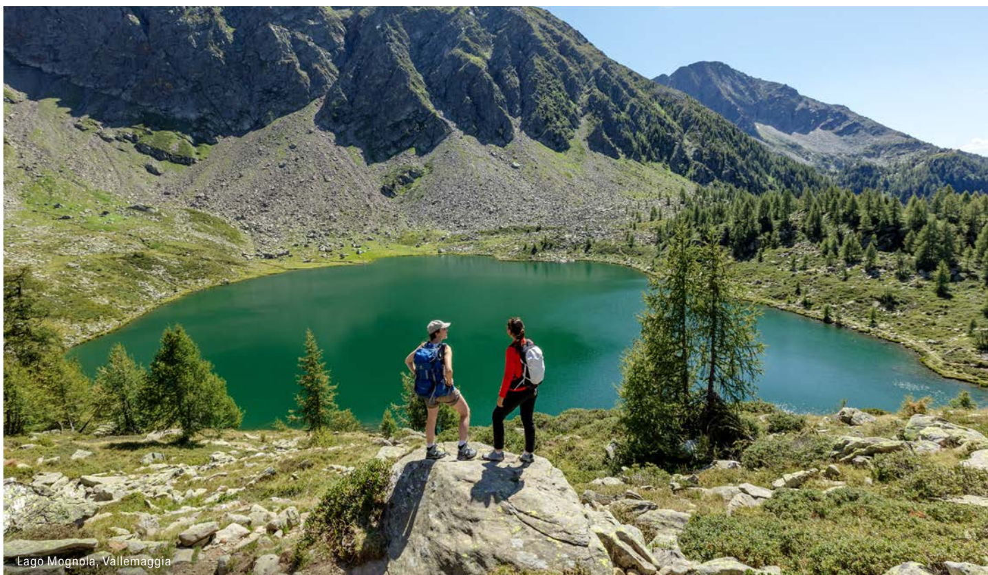
Lago Mognola, Vallemaggia