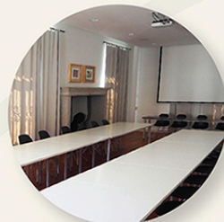
La Sala conferenze