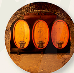
Il Museo del vino