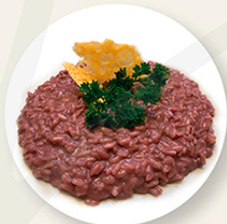
I Piatti tipici