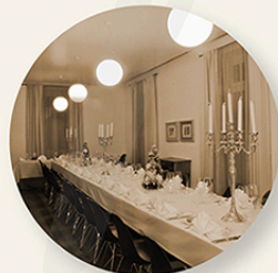
La Sala banchetti