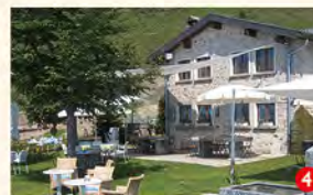
Capanna Lo Stallone Tel. +41 (0)91 743 61 46 capanna@stallone.ch

Insalata e piatto del giorno Salat und Tagesteller