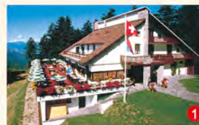
Albergo Ristorante Cardada Tel. +41 (0)91 751 35 95 ristorantecardada@gmail.com

Insalata e piatto del giorno Salat und Tagesteller