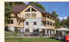
Albergo Ristorante Colmanicchio Tel. +41 (0)91 751 18 25 info@colmanicchio.ch

Insalata e piatto del giorno Salat und Tagesteller