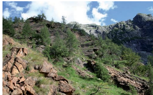
Le caratteristiche rocce ultrabasiche della Val di Capolo

Il substrato geologico, che caratterizza buona parte della Riserva, il clima temperato-insubrico di montagna ricco di precipitazioni e l'elevata umidità dell'aria, determinano condizioni particolari non riscontrabili in altre parti del Ticino.