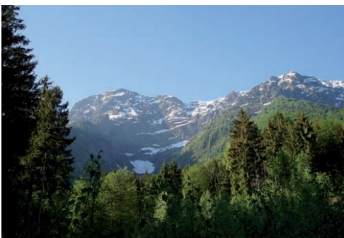
Il Monte Gridone e la riserva forestale visti da Bordei

Una Riserva forestale è un'area coperta da vegetazione arborea lasciata integralmente all'evoluzione naturale e protetta dall'intervento umano. Quando l'evoluzione naturale può agire per un periodo di tempo sufficientemente lungo, si ottiene uno stato prossimo a quello del bosco primario, la cui struttura e composizione sono esclusivamente date dalle condizioni naturali. Suolo, clima e biocenosi nella loro interezza e in tutte le loro manifestazioni non sono influenzate dallo sfruttamento del legname, dal pascolo e da altre utilizzazioni dannose.