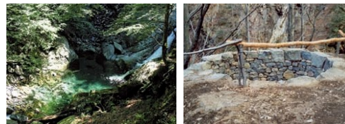
Val di Capolo