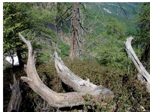
Natura selvaggia nel cuore della riserva forestale (zona delle "Teste")

La presenza di alberi di notevoli dimensioni e di legname morto in piedi e a terra segnala che la foresta è già avviata verso un ambiente di vita più prossimo allo stato naturale, in cui molte specie di insetti, funghi e uccelli possono trovare condizioni di vita ideali.