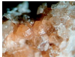
Cristalli di idrogrossularia

Il massiccio del Monte Gridone, nel quale è inclusa la riserva forestale di Palagnedra, appartiene principalmente alla "zona Ivrea-Verbano" che è caratterizzata da rocce molto particolari e rare nelle Alpi, quali peridotiti, serpentiniti, anfiboliti, orneblenditi, pirosseniti e metagabbri. Sono rocce magmatiche a chimismo basico e ultrabasico, cioè composte in prevalenza da minerali con un basso tenore di silice ed un'alta percentuale di magnesio e ferro come l'orneblenda, il pirosseno e l'olivina. Sul terreno, queste rocce sono facilmente individuabili grazie al colore verde scuro (nelle porzioni fresche) o giallo-ocra nelle zone alterate. La zona Ivrea-Verbano è considerata come un lembo di crosta continentale profonda con elementi del mantello superiore spinta in superficie durante la collisione continentale che ha portato alla nascita delle Alpi.